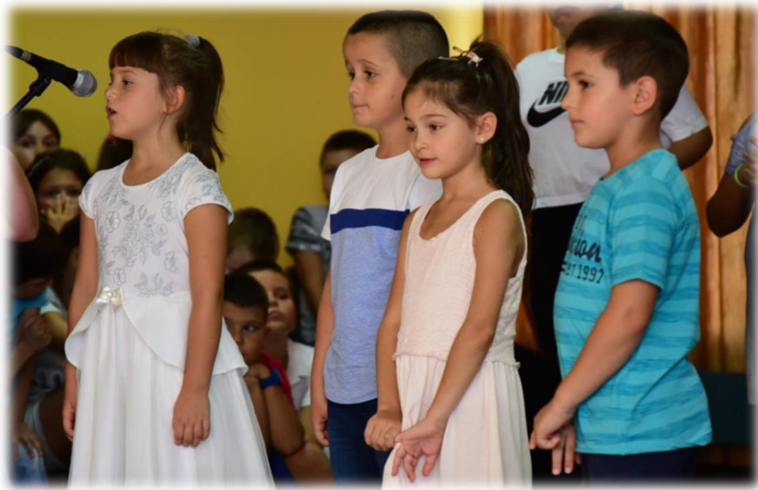
Свечана приредба поводом поласка у први разред