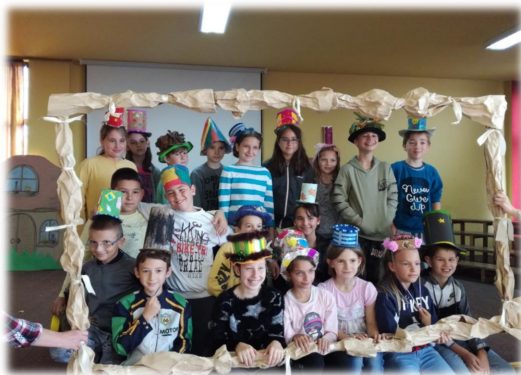
Ученици млађих разреда поносно носе шешире које су сами направили