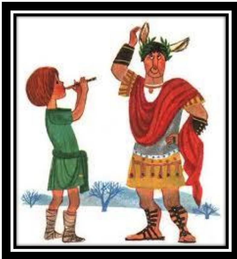
Илустрација – „У цара Тројана козје уши”