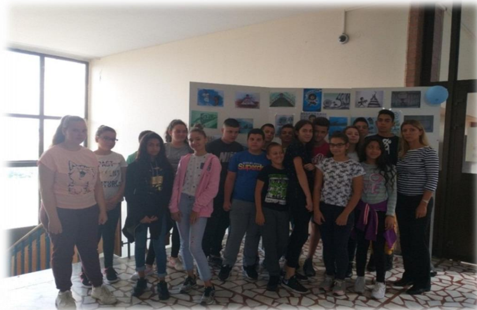
Ученици испред паноа на ком су приказане језичке илустрације