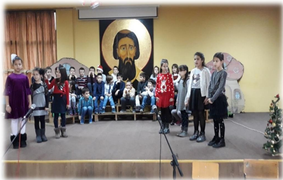
Новогодишња приредба у свечаној сали