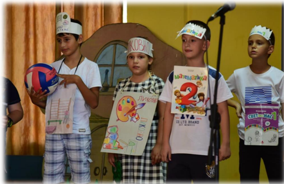
Ученици другог разреда пожелели су добродошлицу првацима и на занимљив начин представили школске предмете