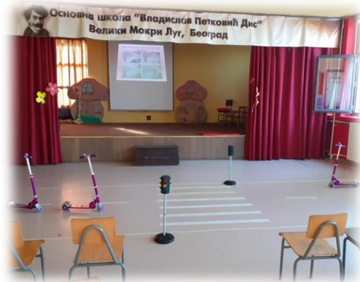
Радионица о саобраћају одржана у Свечаној сали