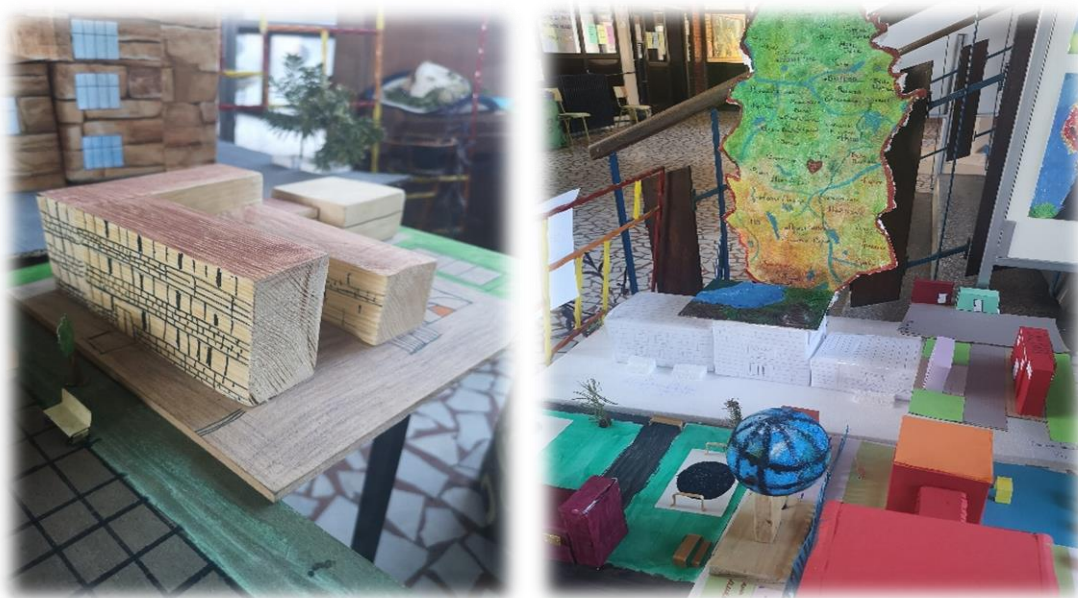
Представљање рада ученика на пројекту „Картографија”

Ученици су показали велико интересовање и изузетну креативност у раду на пројекту, а евалуација рада је спроведена кроз тематску изложбу „Картографија” која је трајала до краја октобра у приземљу школе.