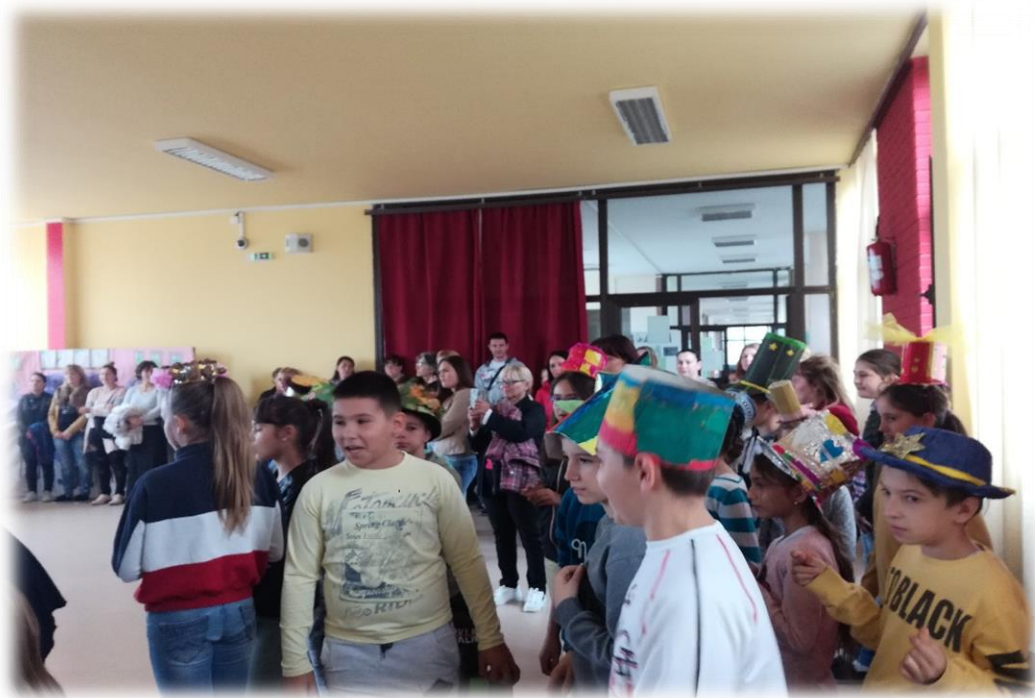
Шеширијада у оквиру Дечије недеље