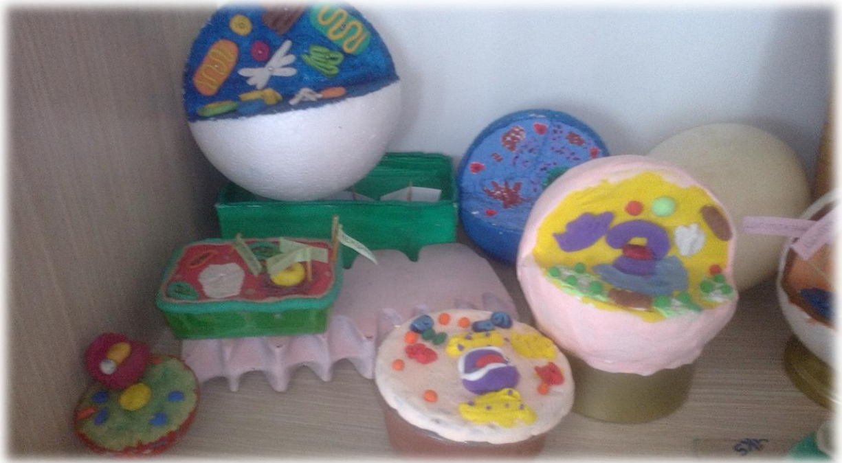
Модел ђелије изложен у холу школе